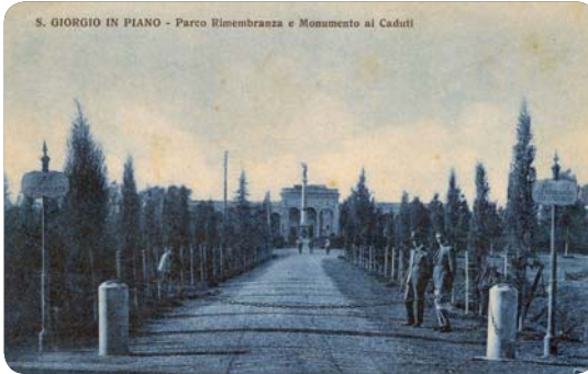
S. GIORGIO IN PIANO - Parco Rimembranza e Monumento ai Caduti

La statua della Vittoria rimase a San Giorgio ancora per alcuni mesi, nell'ottobre del 1941 il Commissario Prefettizio comunicava al Prefetto che "... a seguito degli ordinamenti il Municipio ha da tempo provveduto alla rimozione delle parti in bronzo del monumento. La statua rimossa non è stata ancora spedita alla fonderia in quanto si attendevano istruzioni in proposito..." Nel gennaio dell'anno successivo il comune, forse nel tentativo di trattenere la statua, comunicò al Prefetto: "... Essendo sorto il dubbio che la statua non fosse in bronzo, ne fu sospesa la spedizione per eventuali accertamenti. Essendo ora risaputo che la statua è di bronzo, questo comune provvederà a spedire con sollecitudine il materiale