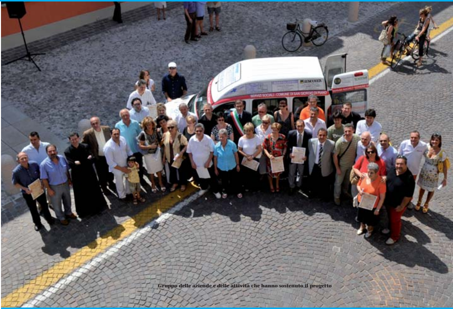
Gruppo delle aziende e delle attività che hanno sostenuto il progetto