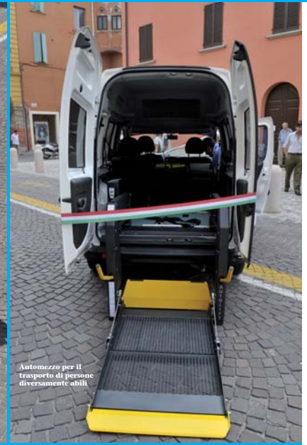
Automezzo per il trasporto di persone diversamente abili