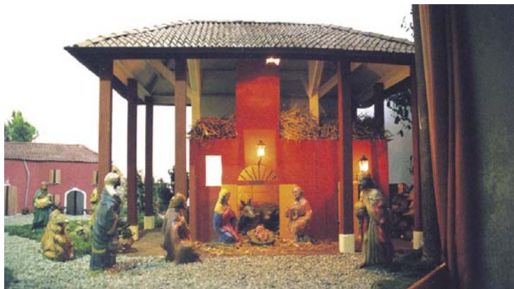
Presepe di Gherghenzano

Nella parrocchia di Gherghenzano è ormai consolidata la tradizione del Presepe, grazie anche ad un gruppo di amici che ogni anno si ritrovano ai primi di novembre ed incominciano a progettare con schizzi diversi prima di scegliere il tema da presentare. Sì, perché ogni anno questo gruppo di amici sceglie un tema sempre diverso nel quale presentare la natività attualizzandola ai giorni nostri. Qui presentiamo due immagini del presepe esposto l'anno scorso, all'interno della chiesa,