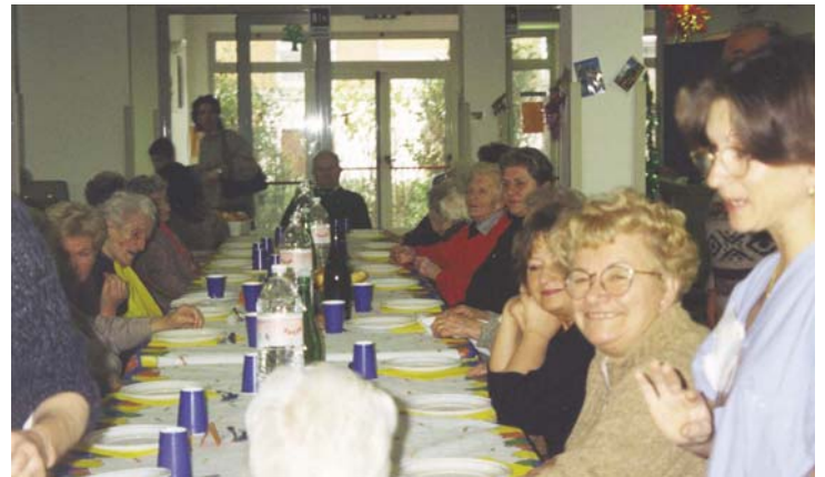
Pranzo di Natale