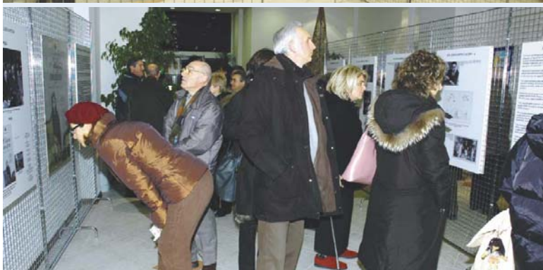
Momenti dell'inaugurazione della mostra avvenuta il 3 dicembre scorso.