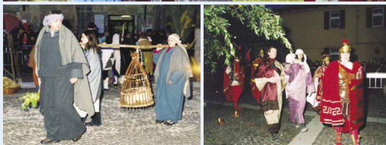
Momenti rappresentativi del Presepe vivente

Anno XXVIII - n. 5 - dicembre 2005 - Pubblicazione bimestrale in distribuzione gratuita